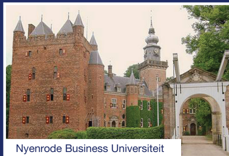
Nyenrode Business Universiteit